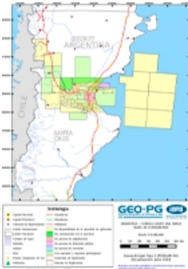
1) Golfo San Jorge

El precio comprende el SEI. Firmo. Se admiten tarjetas de crédito, crédito, cheque o depósito