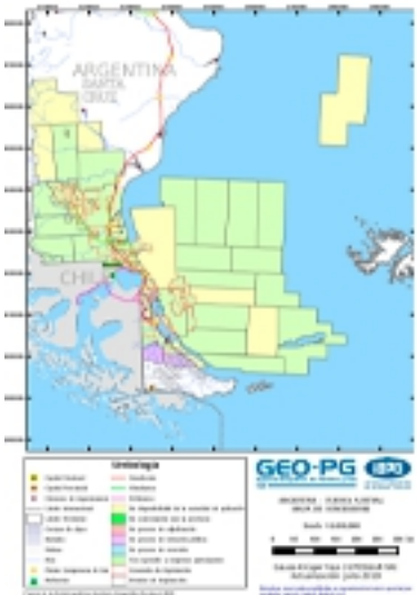
4) Cuenca Austral