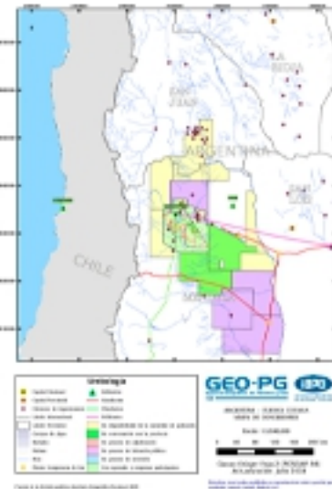
3) Cuenca Cuyana