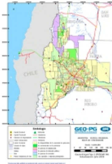
2) Cuenca Neuquina